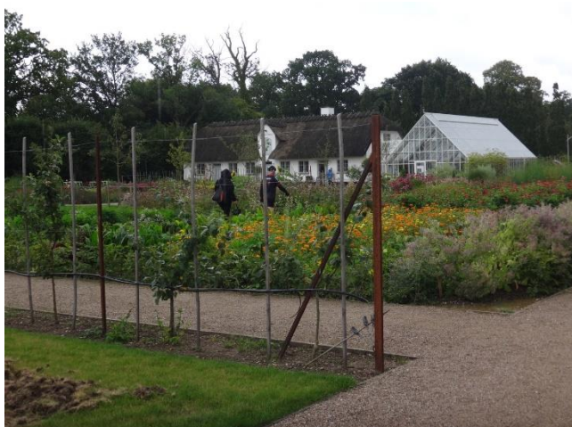
bede og bygning

I blandet sommervejr mødtes 16 havehistorisk nysgerrige og forventningsfulde gæster i dronningens køkkenhave ved Graasten slot. En kyndig og engageret guide gjorde os klogere på havens historie. Den blev anlagt i 1960 på dronning Ingrid's initiativ og blev godt hjulpet af hendes talentfulde engagement. Efter hendes død begyndte haven at forfalde, indtil der i 2014 i samarbejde med Sønderborg kommune blev igangsat en udvikling af haven, som blev indviet sommeren 2020. Det var altså en ganske ung have, vi fik lejlighed til at opleve.