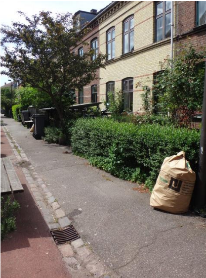
Toftebakkevej grøn velkomst