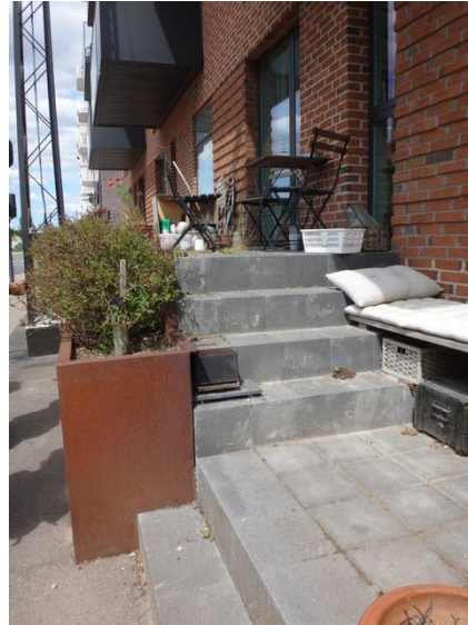
Grønttorvet privat zone