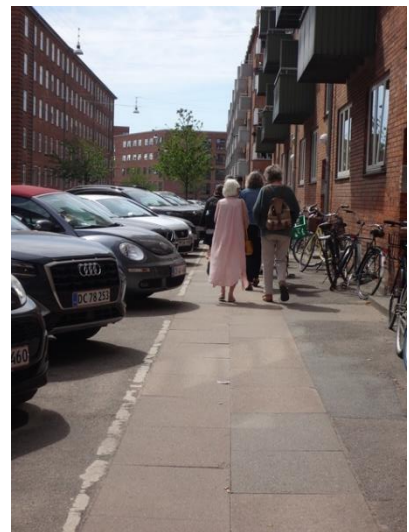
Vigerslev allé biler dominerer