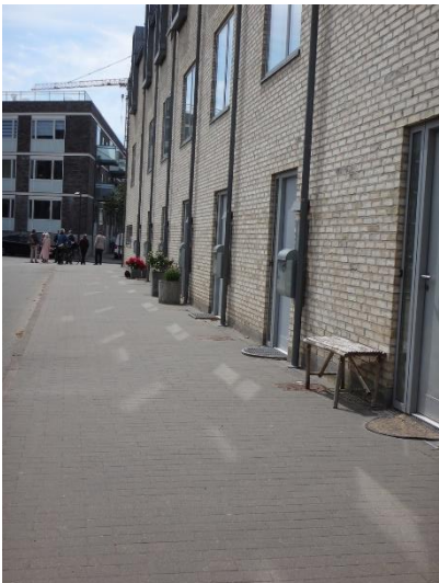
Grønttorvet anonyme indgange

Cykler, biler og affaldspladser er blevet nye elementer i udformningen af ankomsten. Visitkortet, overgangen fra det offentlige til det private rum veksler i mange tilfælde fra grønt til gråt, men det synes dog som om, at der igen gives plads til planterne og den personlige udfoldelse.